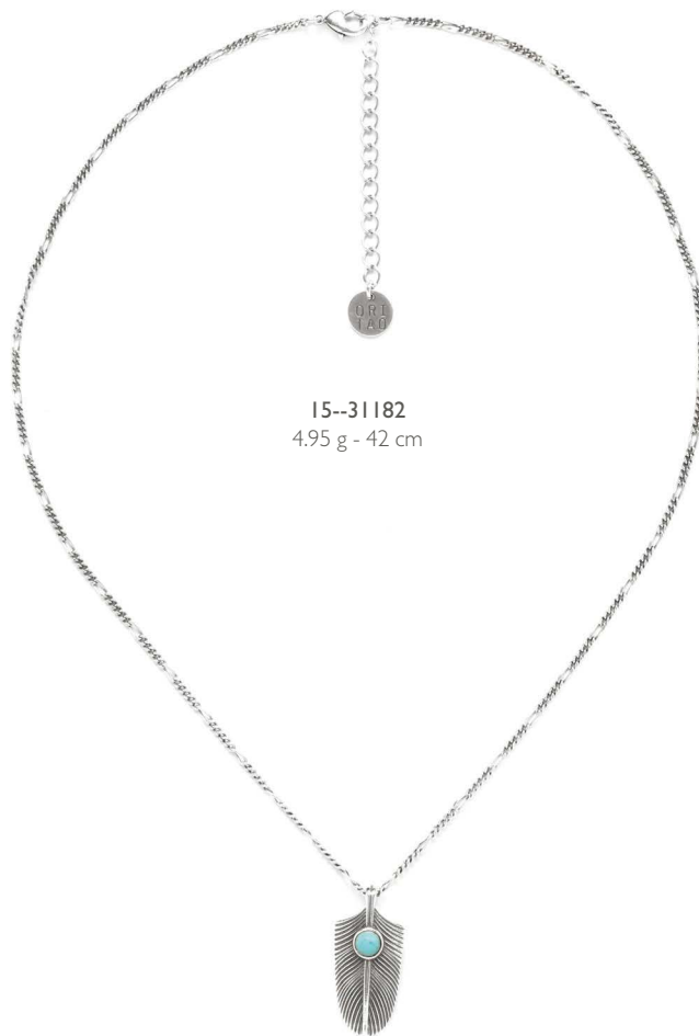
15--31182 4.95 g - 42 cm