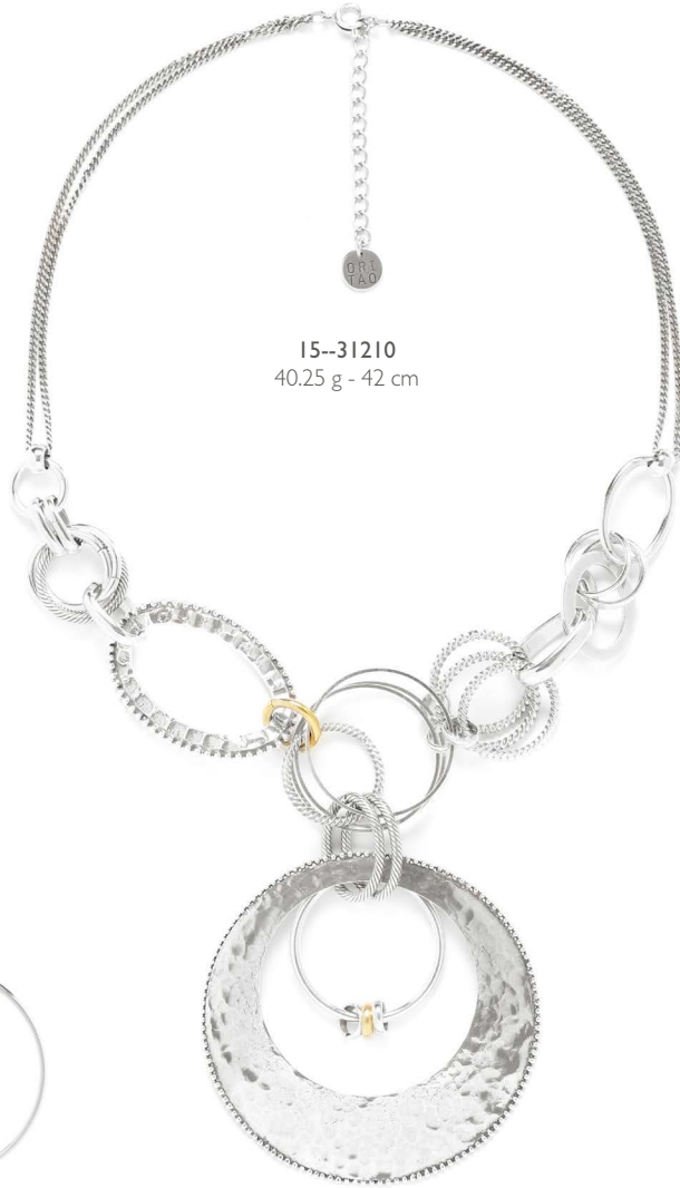
15--31210 40.25 g - 42 cm