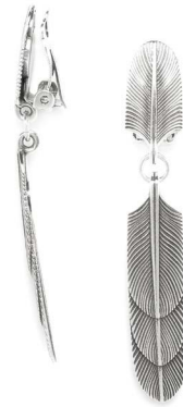
11--30403 Clip 13.75 g - 6 cm