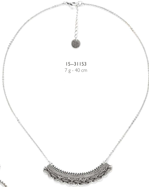
15--31153 7 g - 40 cm