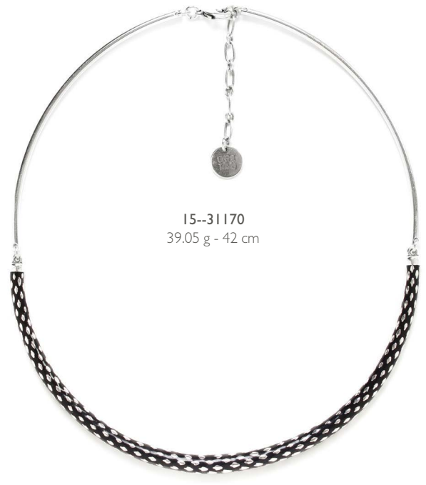
15--31170 39.05 g - 42 cm