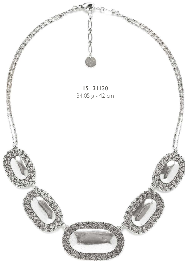
15--31130 34.05 g - 42 cm