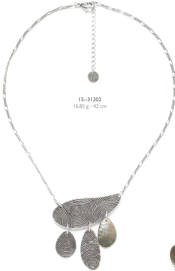
15--31202 16.85 g - 42 cm