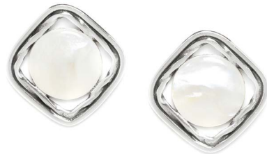
12--30373 Post 17.60 g - 3 cm