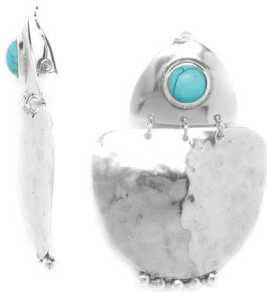
11--30440 Clip 20.05 g - 5 cm