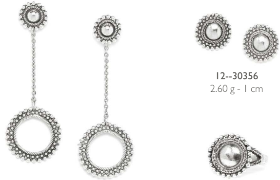
12--30358 3.85 g - 5 cm