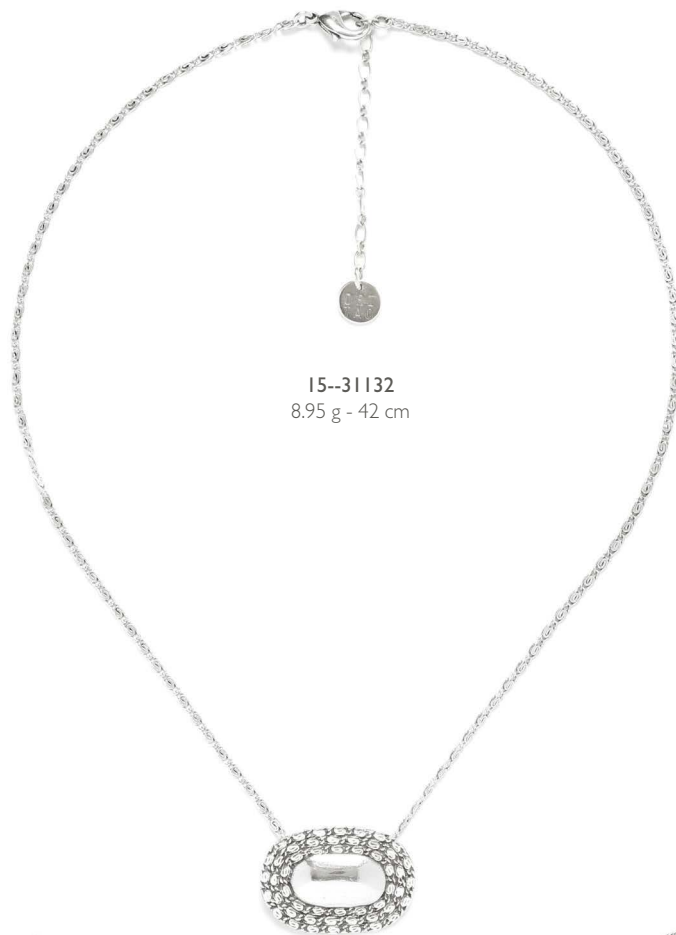
15--31132 8.95 g - 42 cm