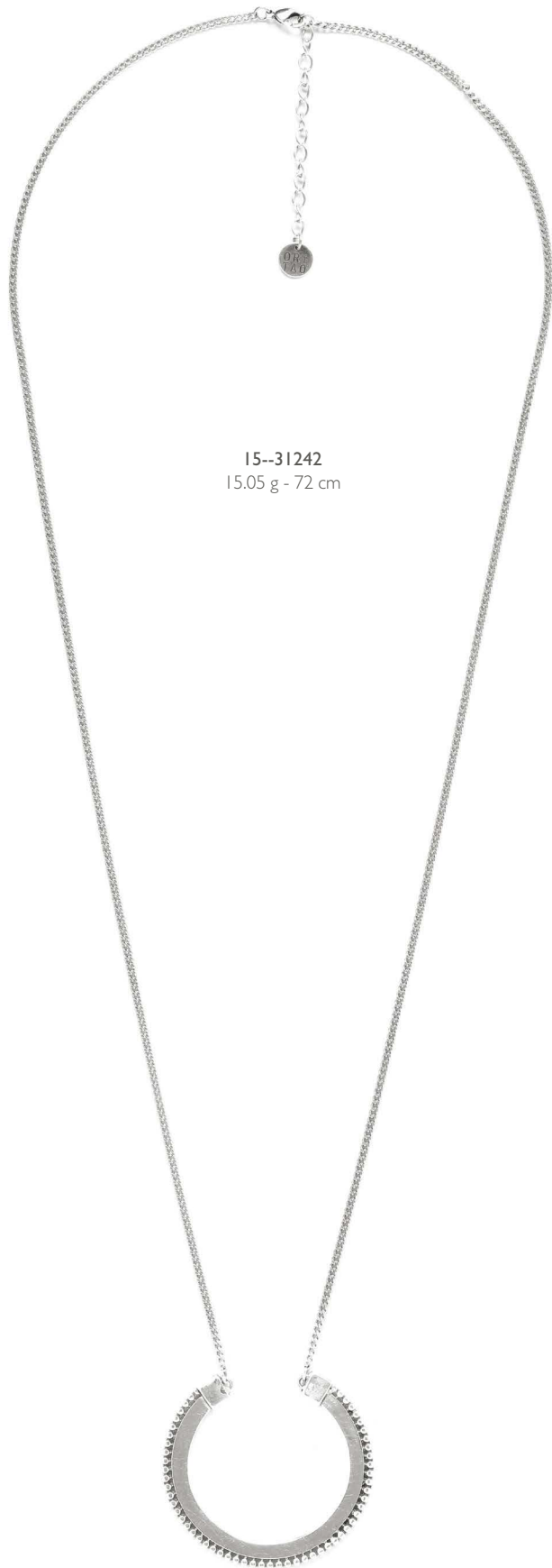
15--31242 15.05 g - 72 cm