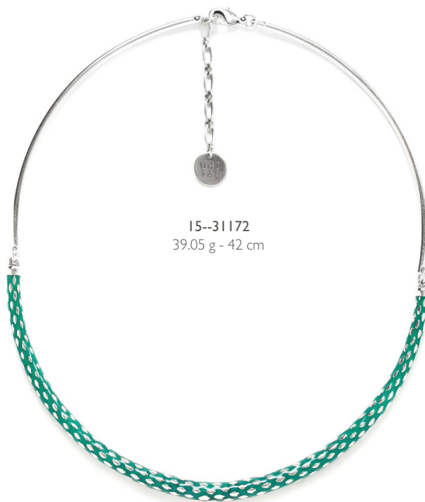
15--31172 39.05 g - 42 cm