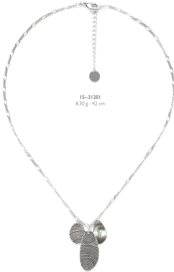
15--31201 8.30 g - 42 cm