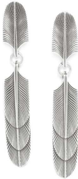
12--30403 Post 10.45 g - 6 cm