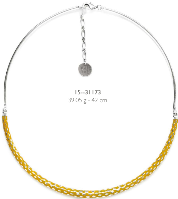
15--31173 39.05 g - 42 cm