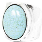
19--40020 Size 56 19--40021 Size 58 8.35 g / 9.95 g