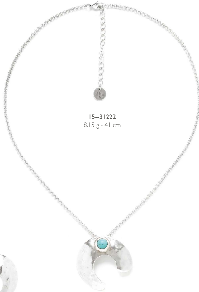
15--31222 8.15 g - 41 cm