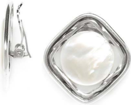
11--30373 Clip 19.85 g - 3 cm