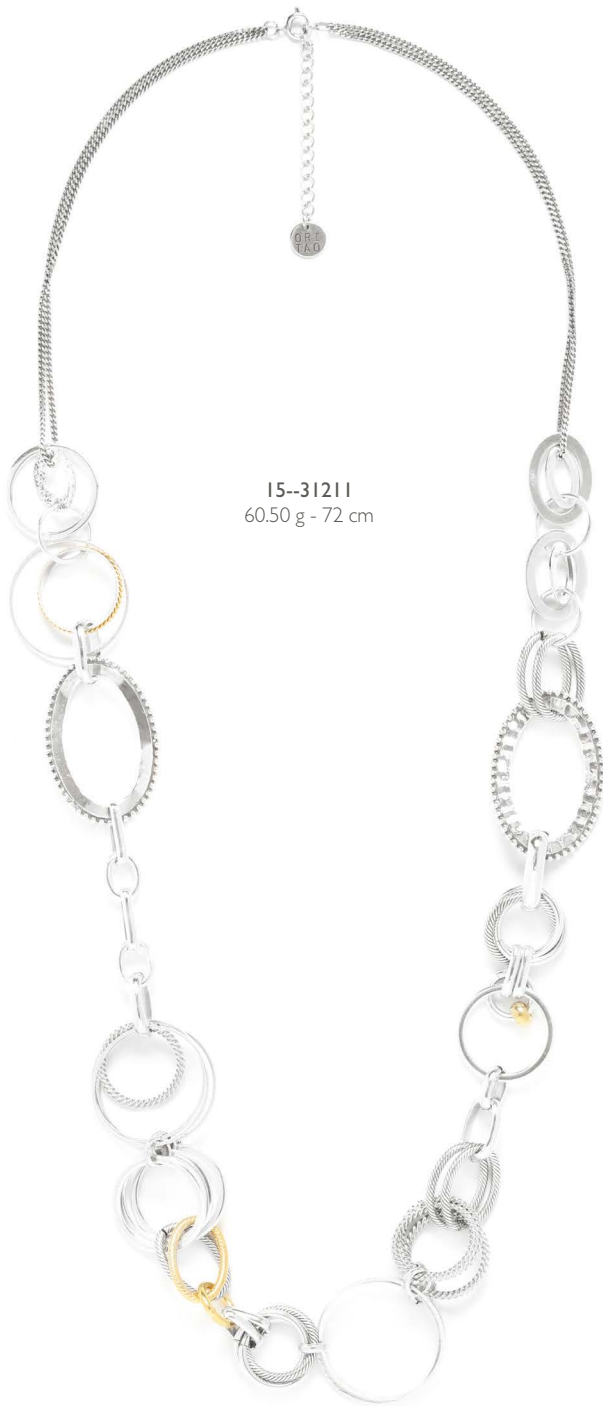
15--31211 60.50 g - 72 cm