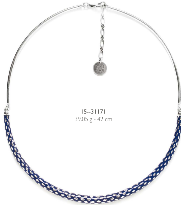
15--31171 39.05 g - 42 cm