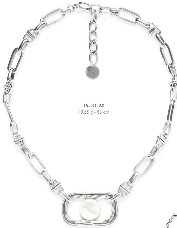
15--31160 49.55 g - 43 cm