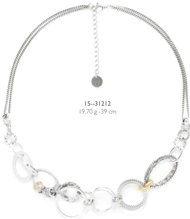
15--31212 19.70 g - 39 cm