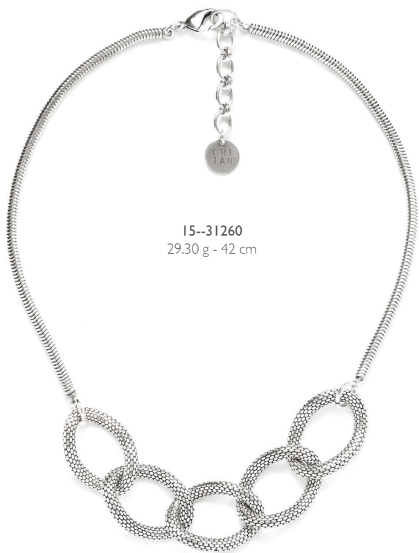
15--31260 29.30 g - 42 cm