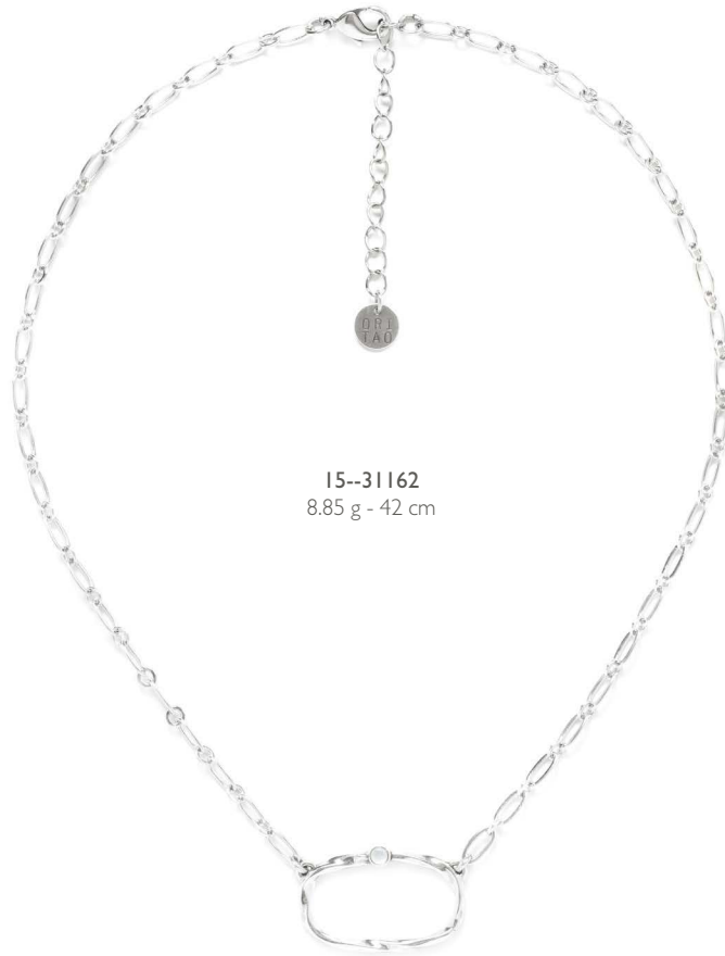
15--31162 8.85 g - 42 cm