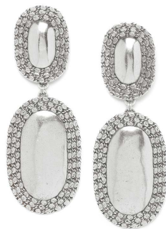
12--30345 Post 25.60 g - 7 cm