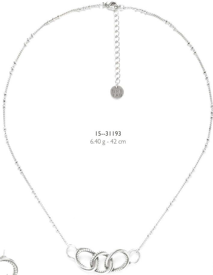
15--31193 6.40 g - 42 cm