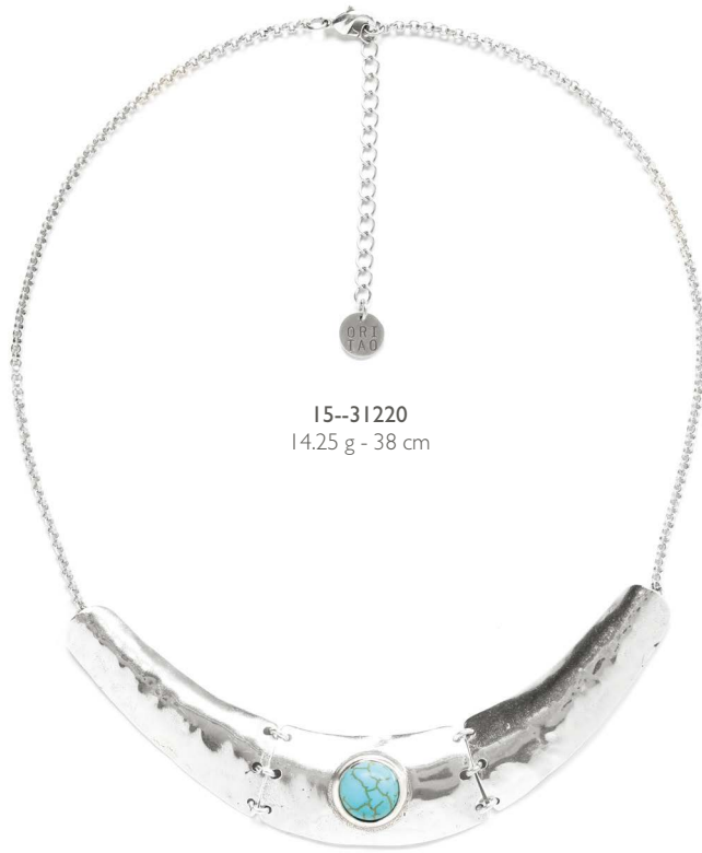
15--31220 14.25 g - 38 cm