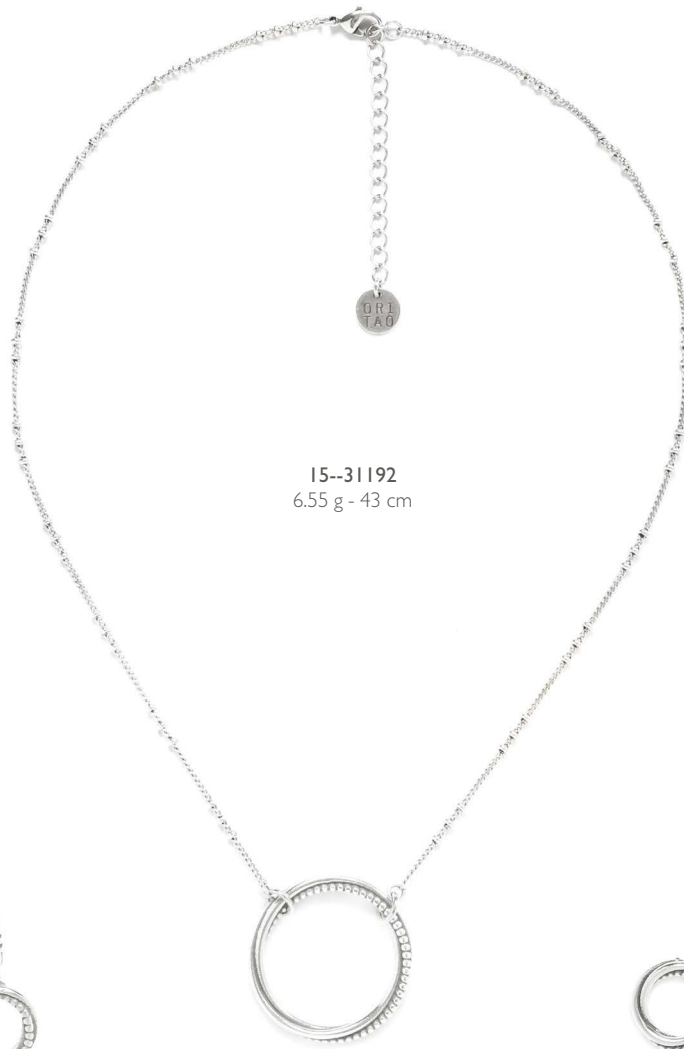
15--31192 6.55 g - 43 cm