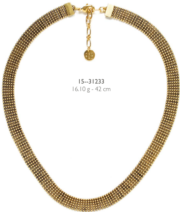
15--31233 16.10 g - 42 cm