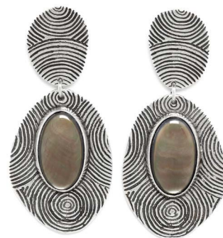
12--30425 Post 20.05 g - 6 cm