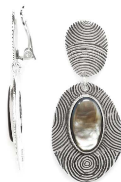
11--30425 Clip 22.65 g - 6 cm