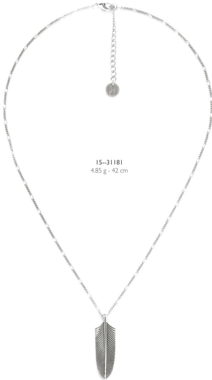
15--31181 4.85 g - 42 cm