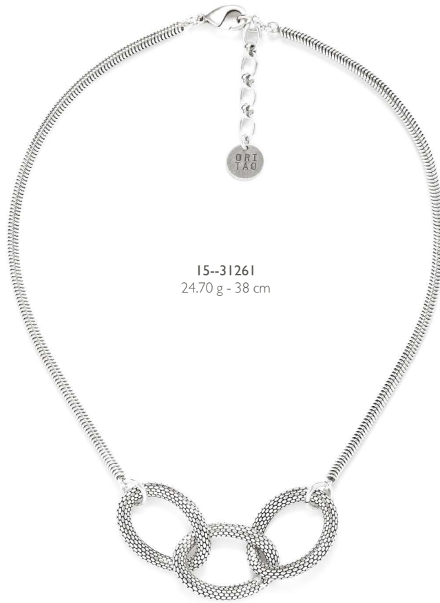
15--31261 24.70 g - 38 cm