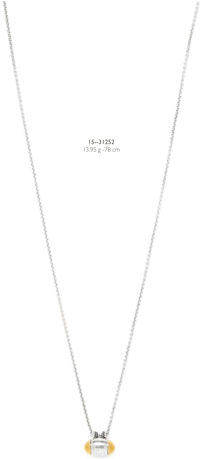
15--31252 13.95 g -78 cm