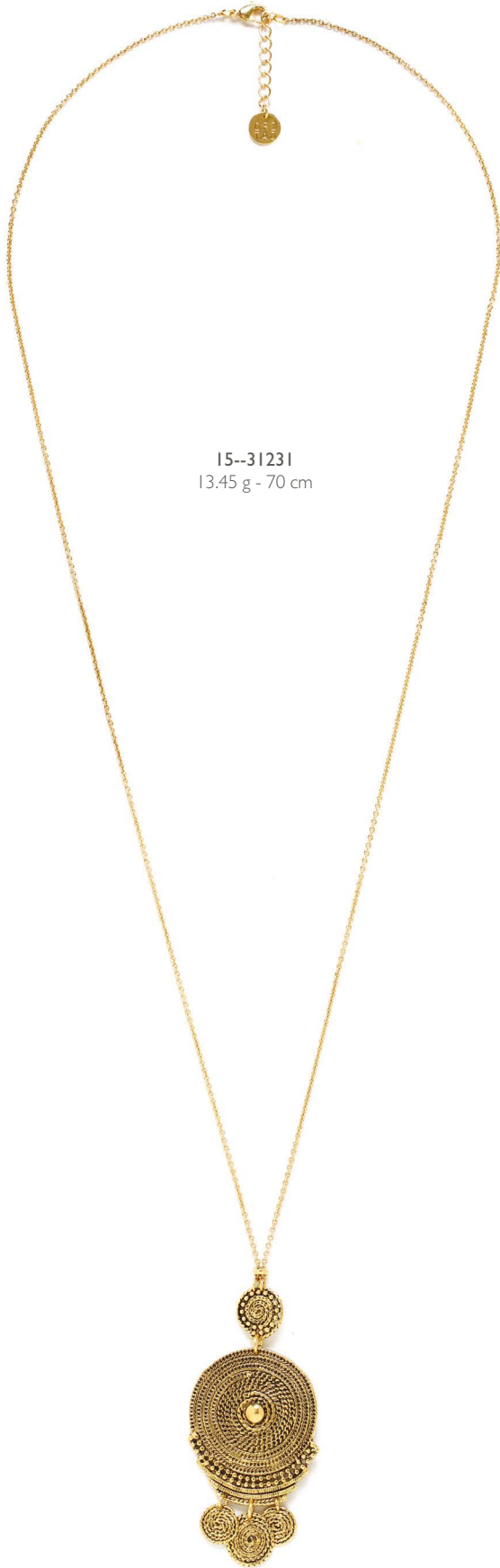
15--31231 13.45 g - 70 cm