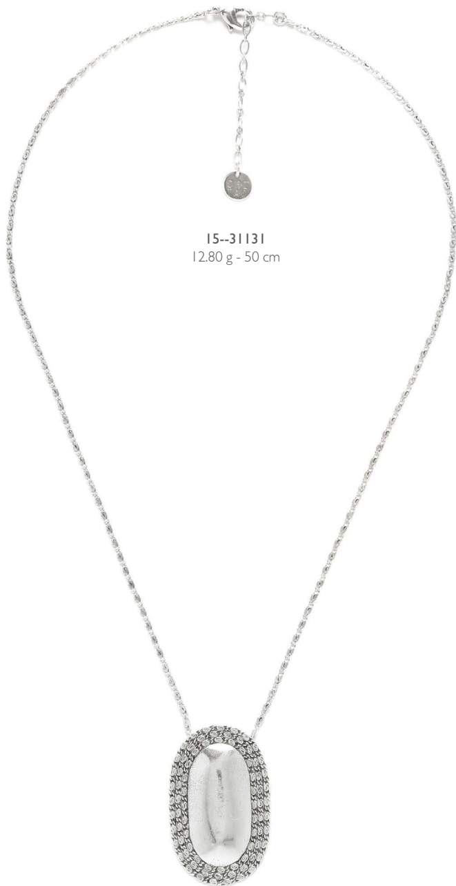
15--31131 12.80 g - 50 cm