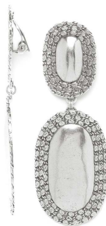
11--30345 Clip 23.65 g - 7 cm