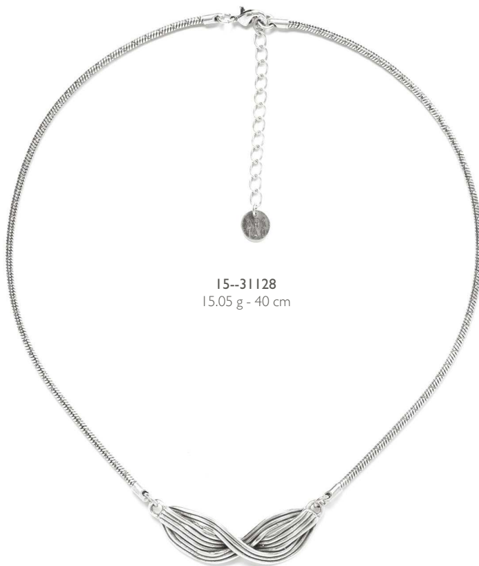
15--31128 15.05 g - 40 cm