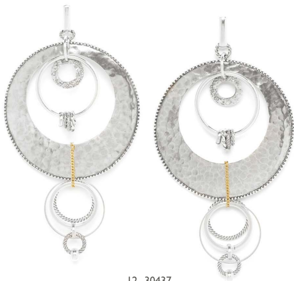
12--30437 32.50 g - 12 cm