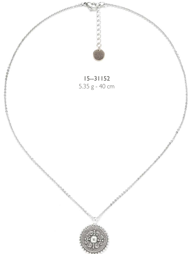
15--31152 5.35 g - 40 cm