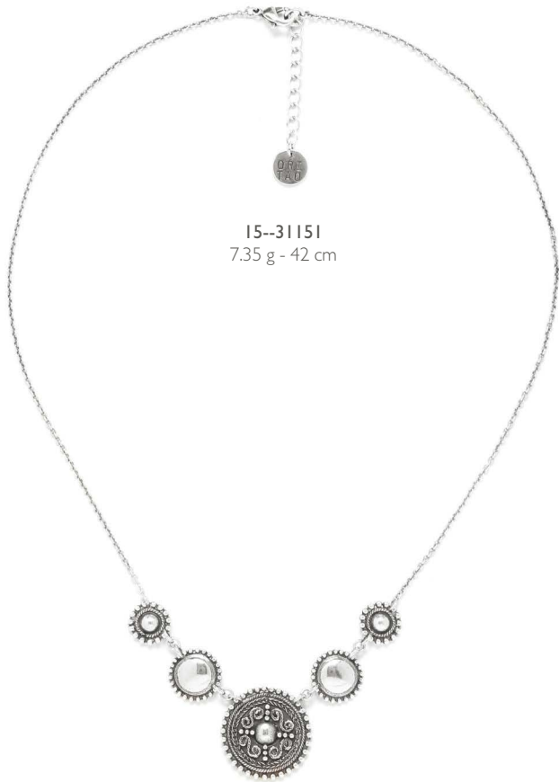
15--31151 7.35 g - 42 cm