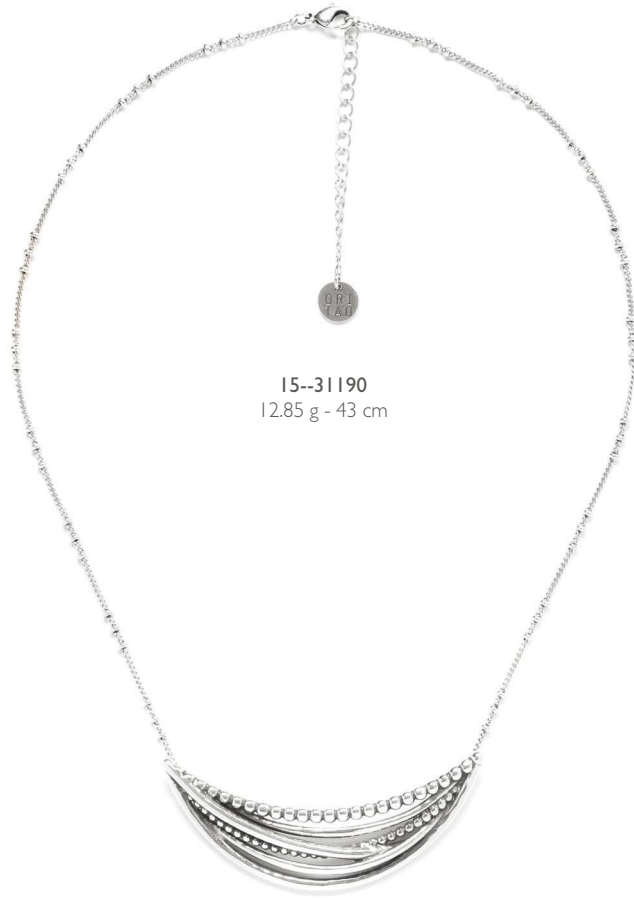
15--31190 12.85 g - 43 cm