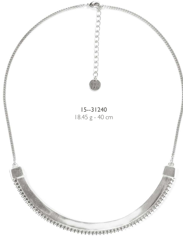
15--31240 18.45 g - 40 cm