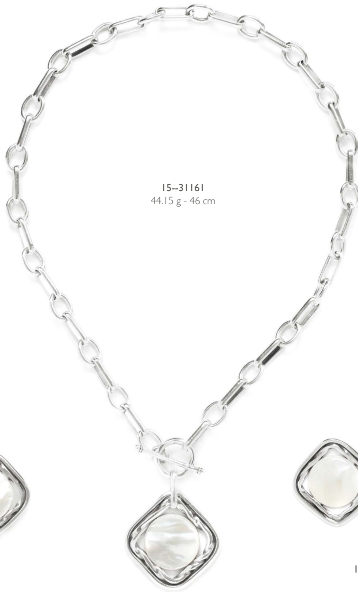
15--31161 44.15 g - 46 cm