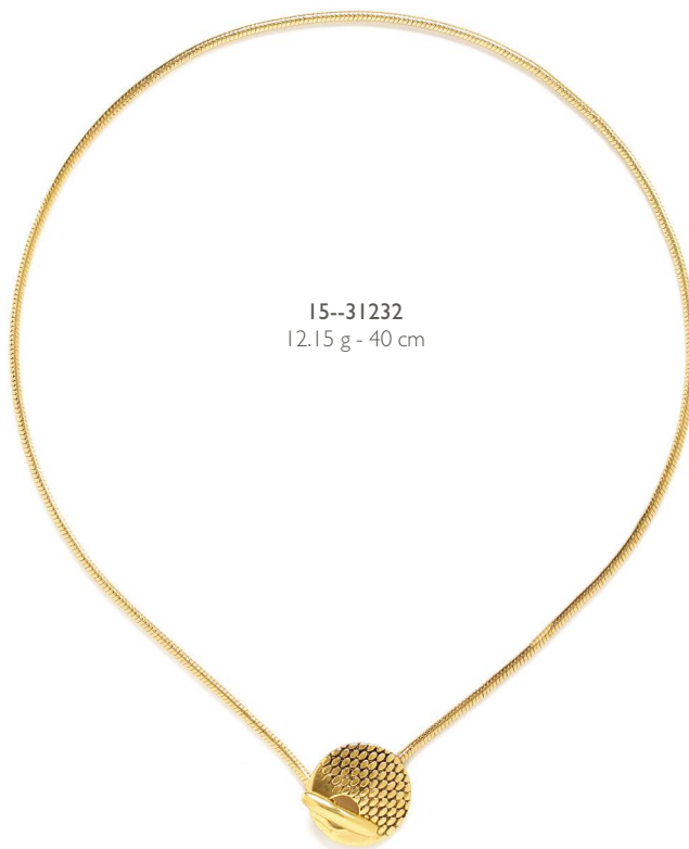
15--31232 12.15 g - 40 cm