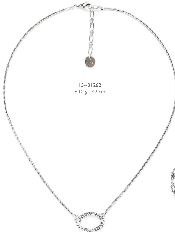
15--31262 8.10 g - 42 cm