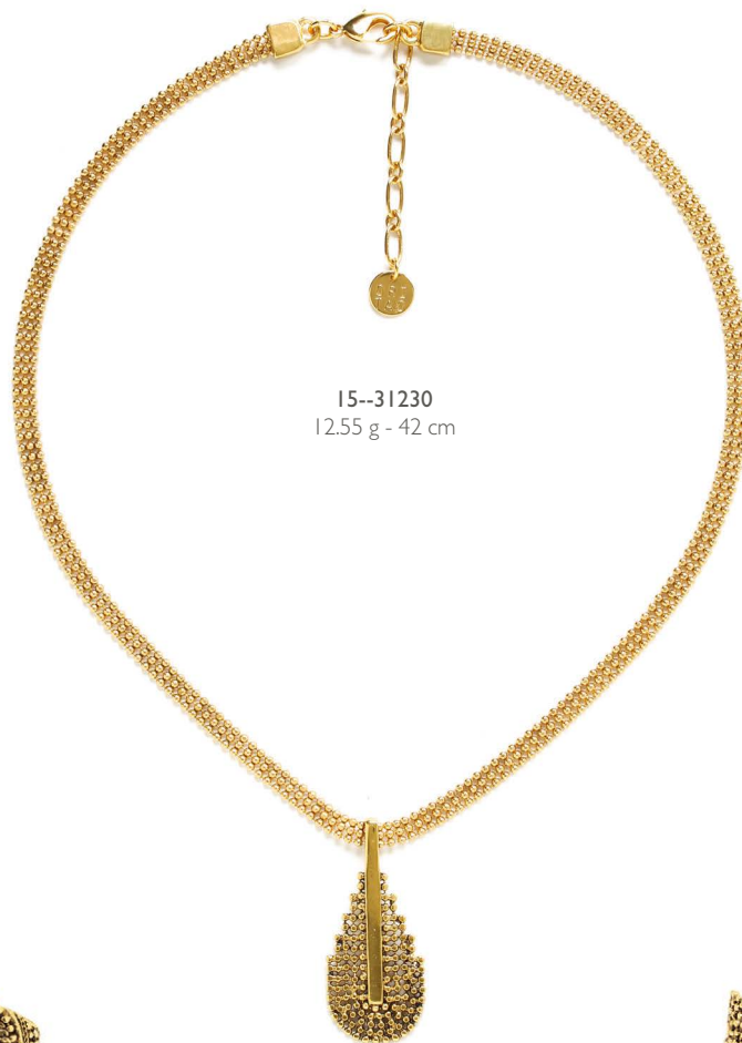
15--31230 12.55 g - 42 cm