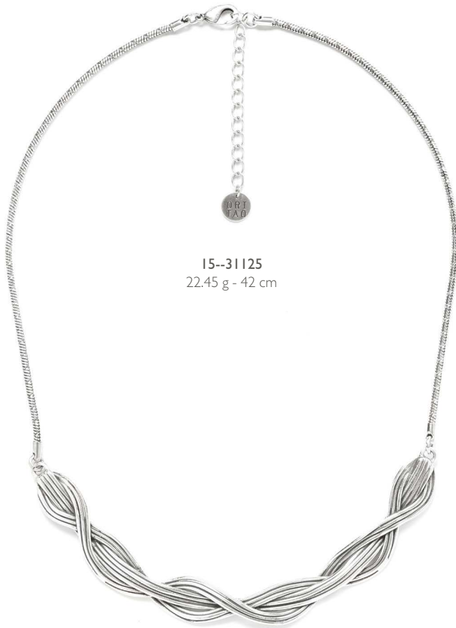
15--31125 22.45 g - 42 cm