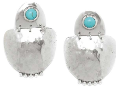
12--30440 Post 17.30 g - 5 cm