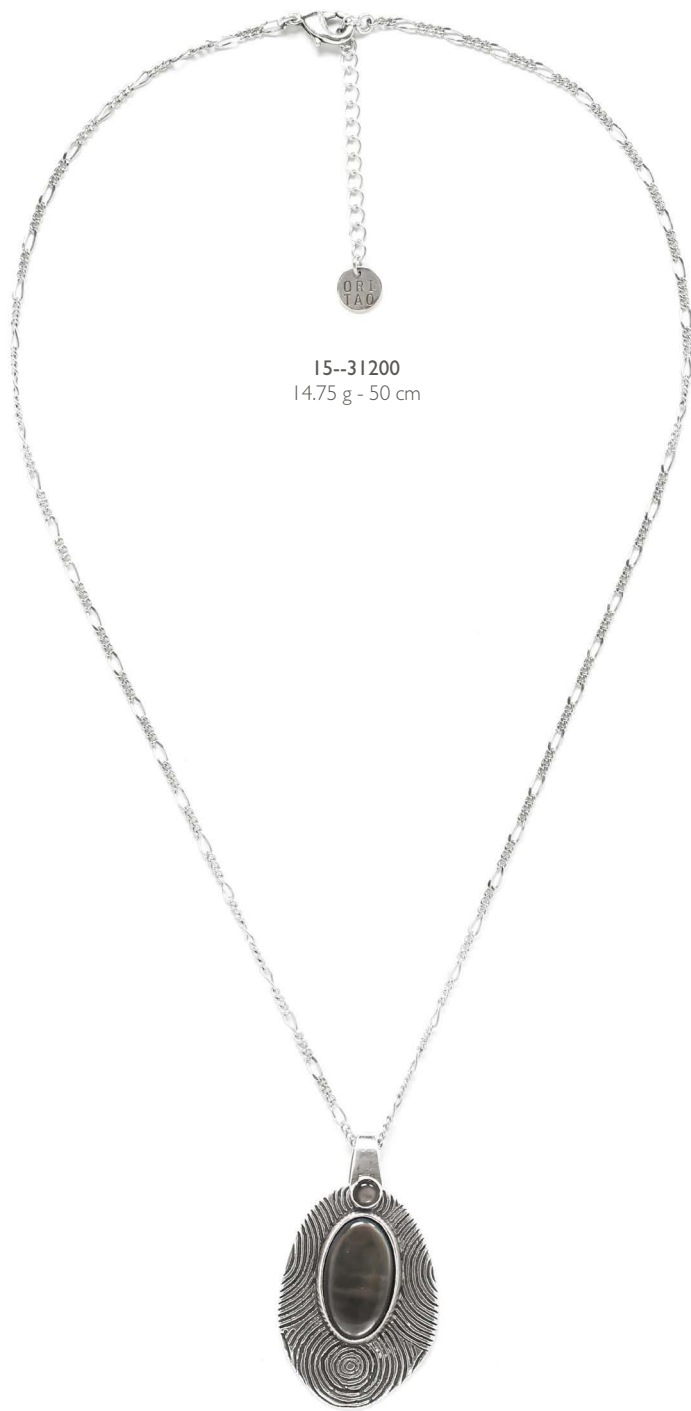
15--31200 14.75 g - 50 cm