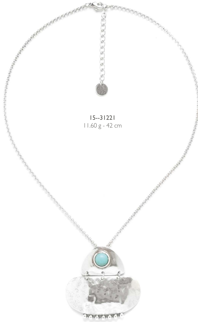
15--31221 11.60 g - 42 cm