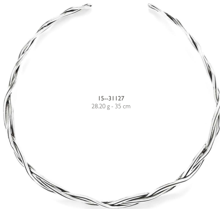
15--31127 28.20 g - 35 cm