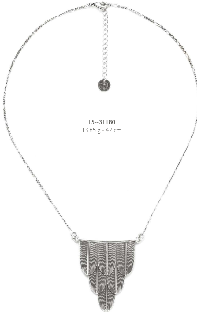
15--31180 13.85 g - 42 cm