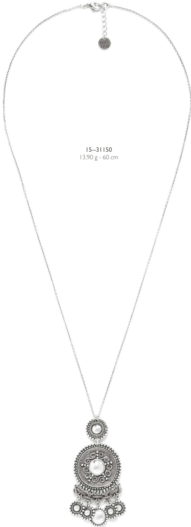
15--31150 13.90 g - 60 cm