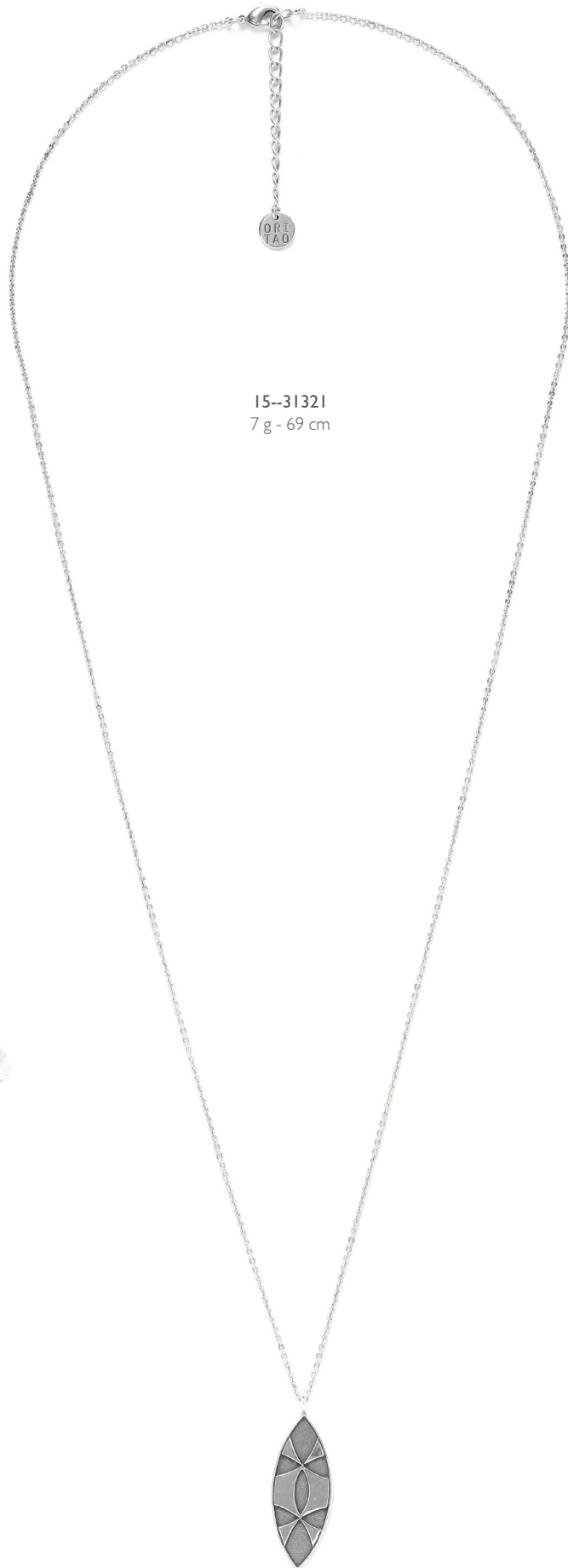
15--31321 7 g - 69 cm