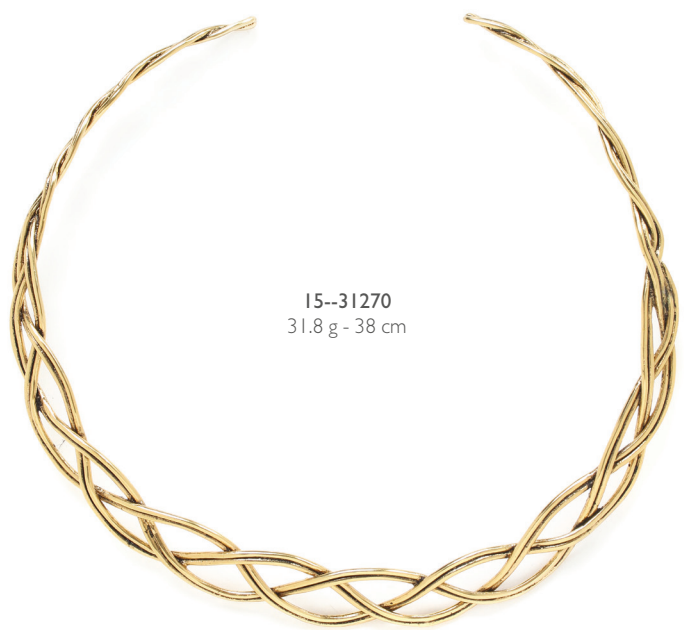
15--31270 31.8 g - 38 cm