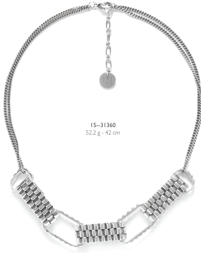
15--31360 52.2 g - 42 cm