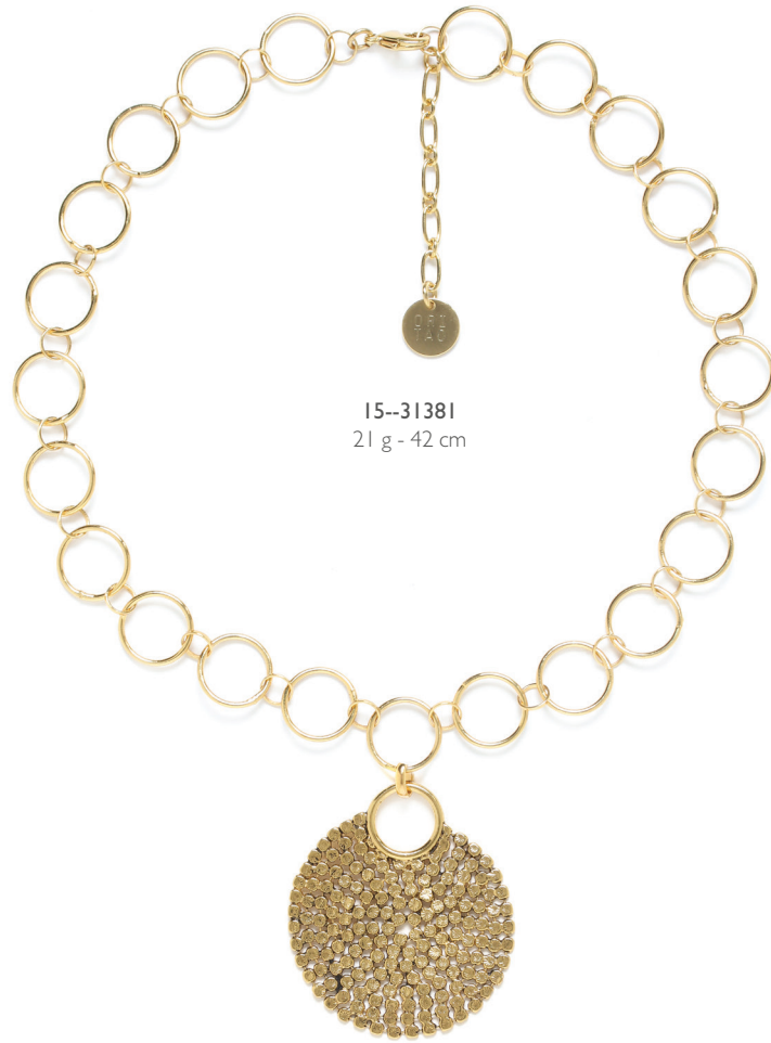
15--31381 21 g - 42 cm