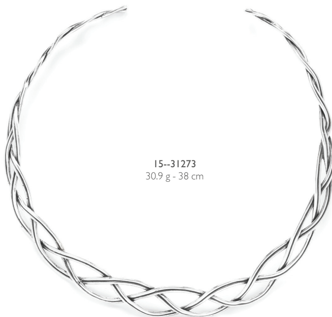
15--31273 30.9 g - 38 cm