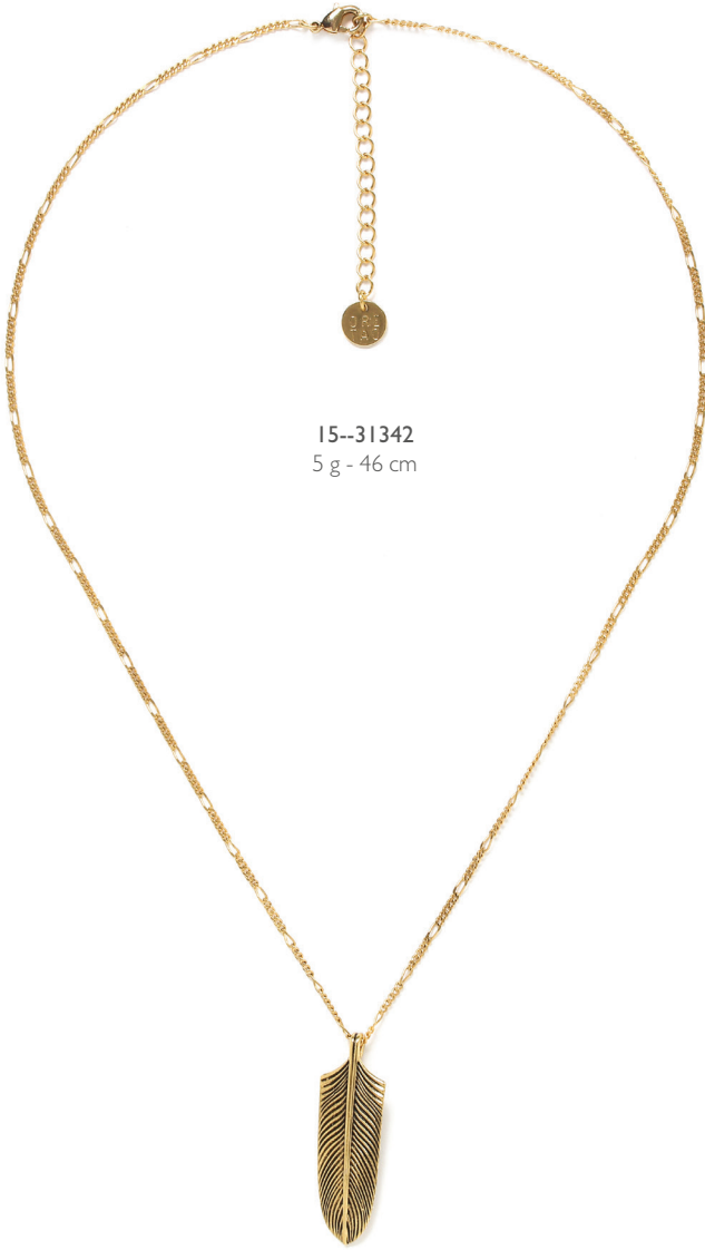
15--31342 5 g - 46 cm