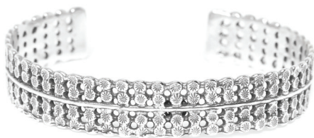
13--59910 13.7 g - 58 cm