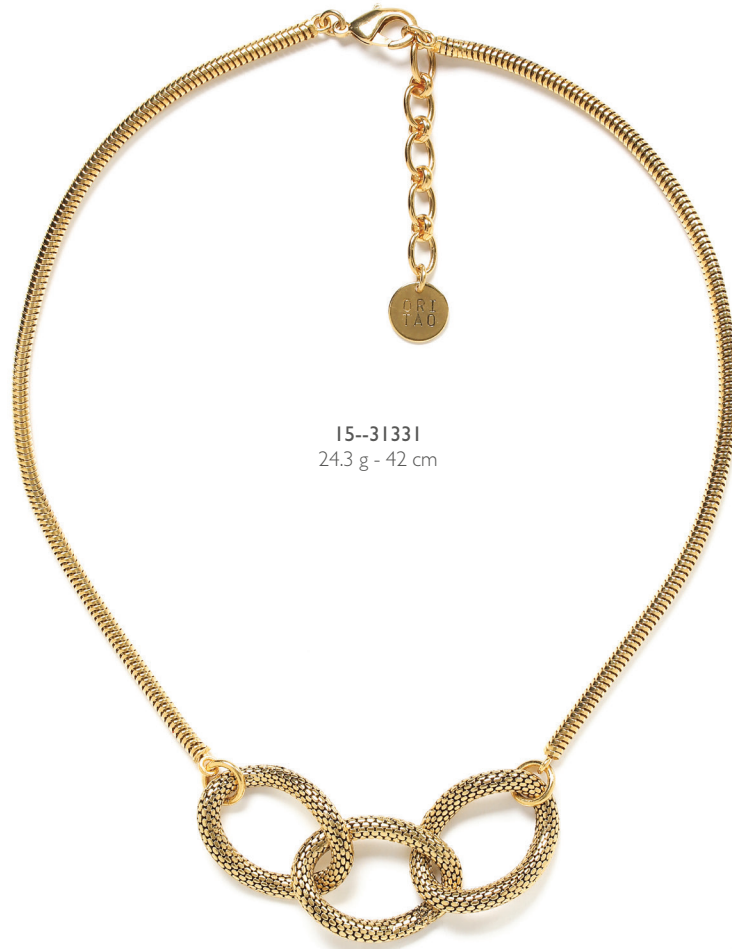
15--31331 24.3 g - 42 cm