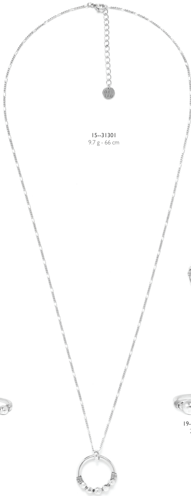
15--31301 9.7 g - 66 cm