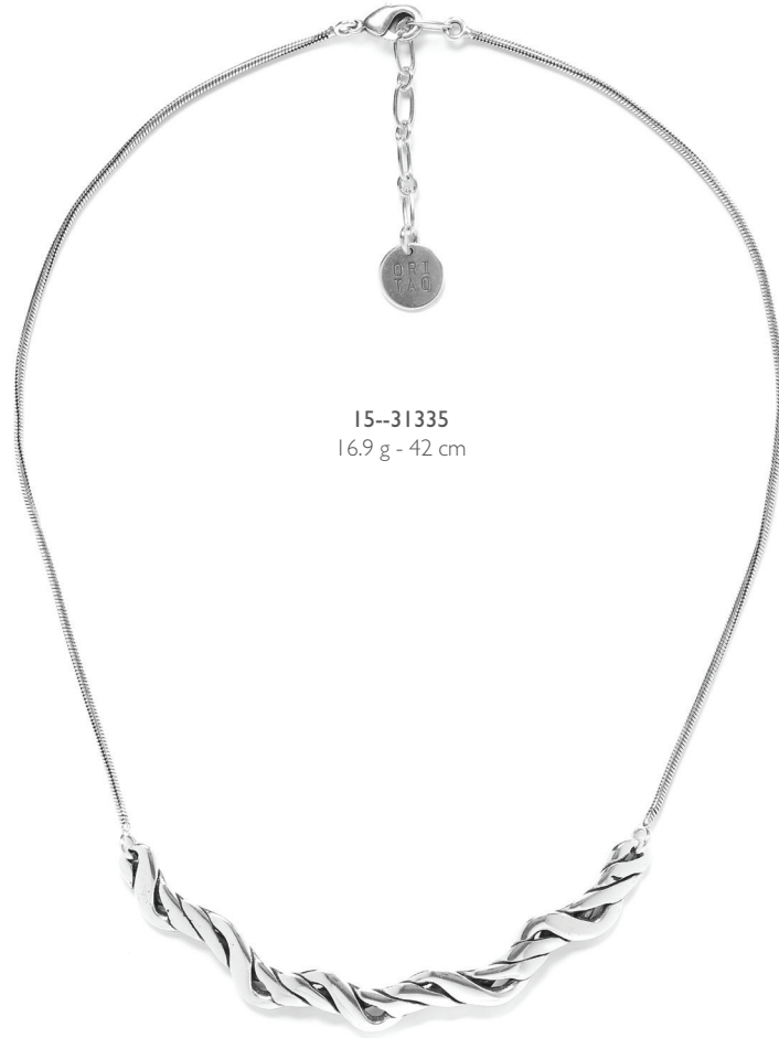
15--31335 16.9 g - 42 cm