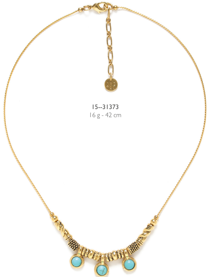
15--31373 16 g - 42 cm