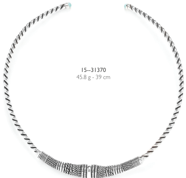
15--31370 45.8 g - 39 cm