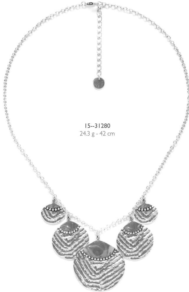
15--31280 24.3 g - 42 cm