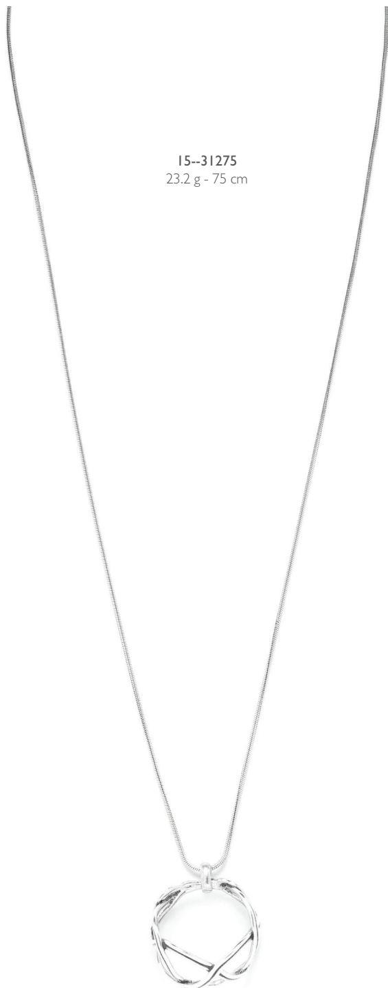
15--31275 23.2 g - 75 cm