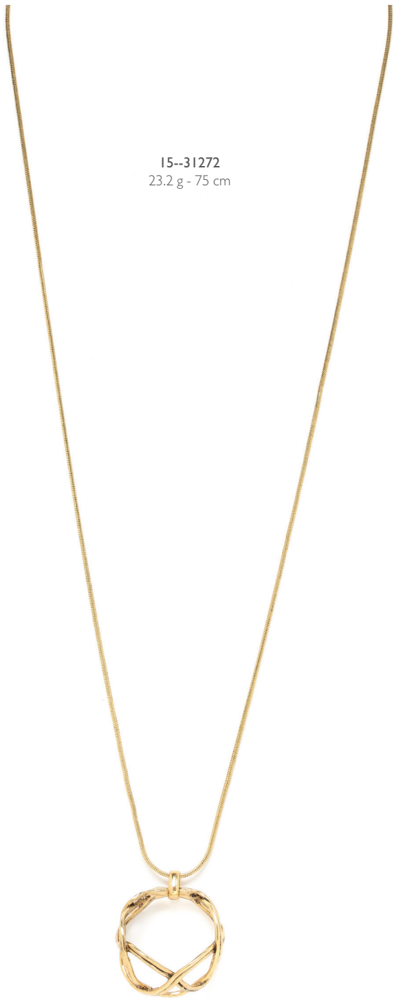
15--31272 23.2 g - 75 cm