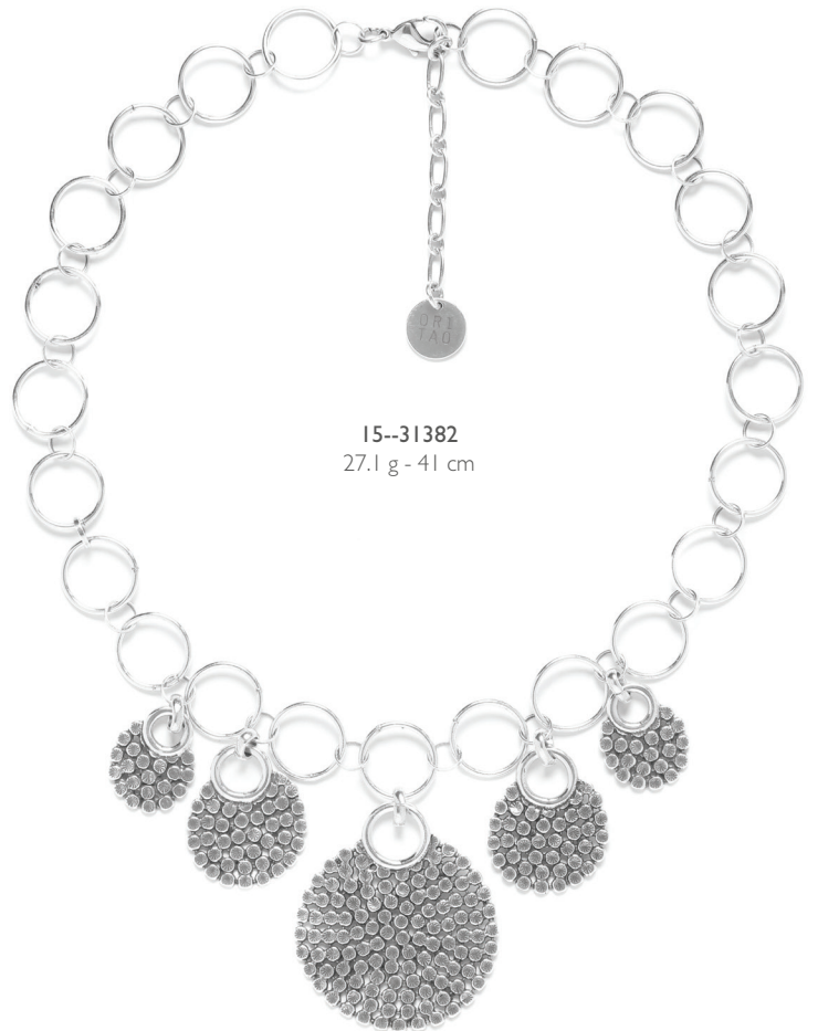
15--31382 27.1 g - 41 cm