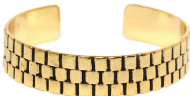
13--59891 25.7 g - 58 cm