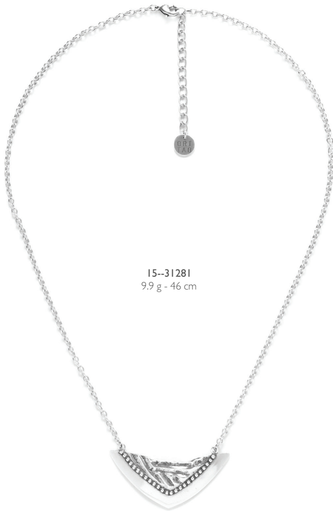
15--31281 9.9 g - 46 cm