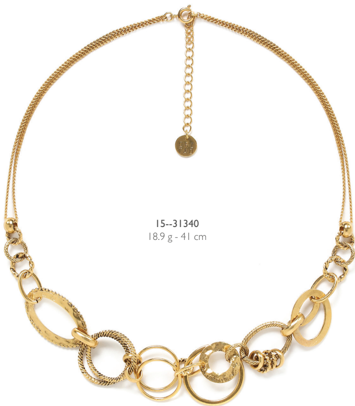
15--31340 18.9 g - 41 cm