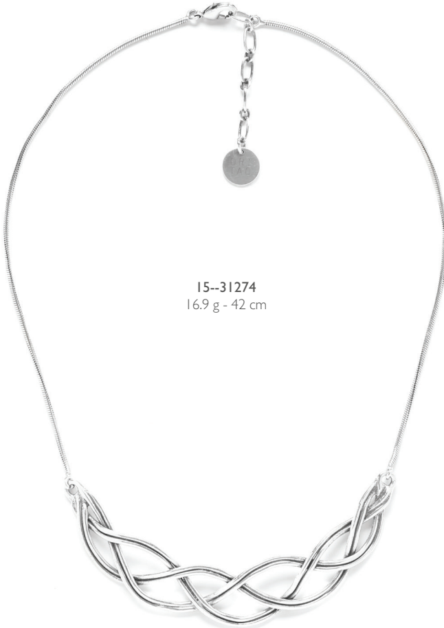
15--31274 16.9 g - 42 cm