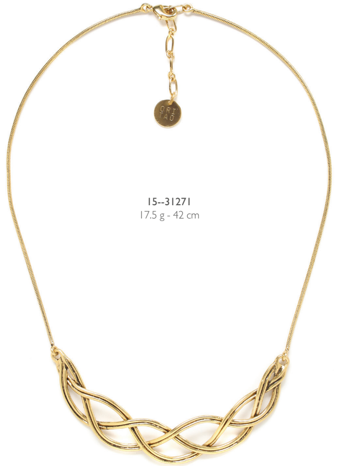
15--31271 17.5 g - 42 cm