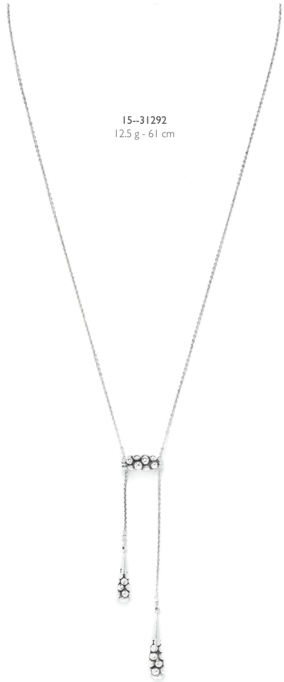
15--31292 12.5 g - 61 cm