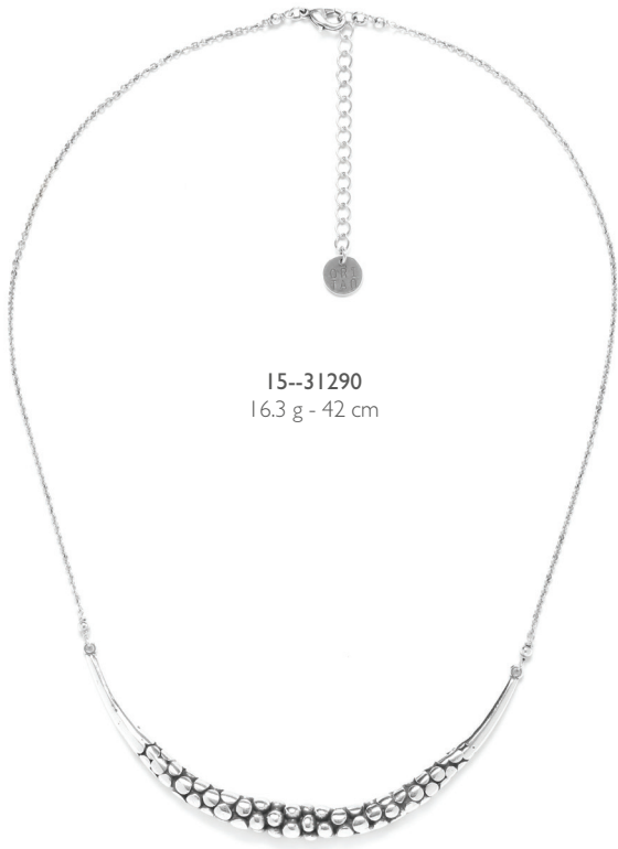
15--31290 16.3 g - 42 cm