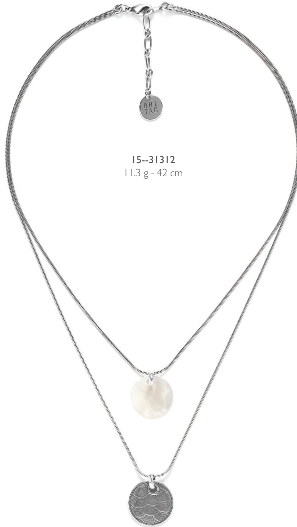
15--31312 11.3 g - 42 cm