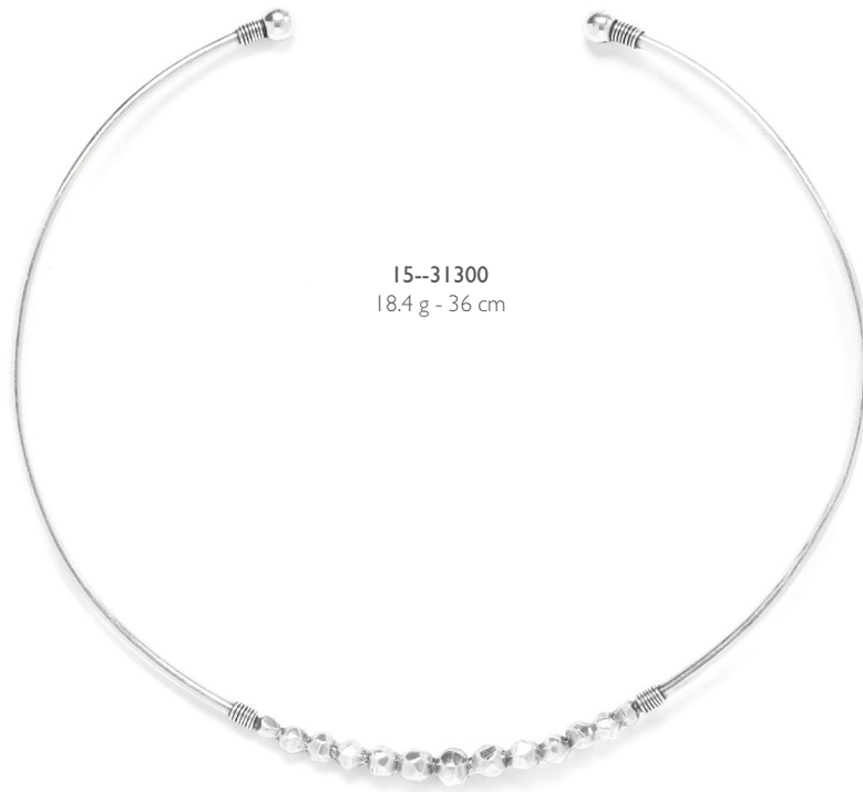
15--31300 18.4 g - 36 cm