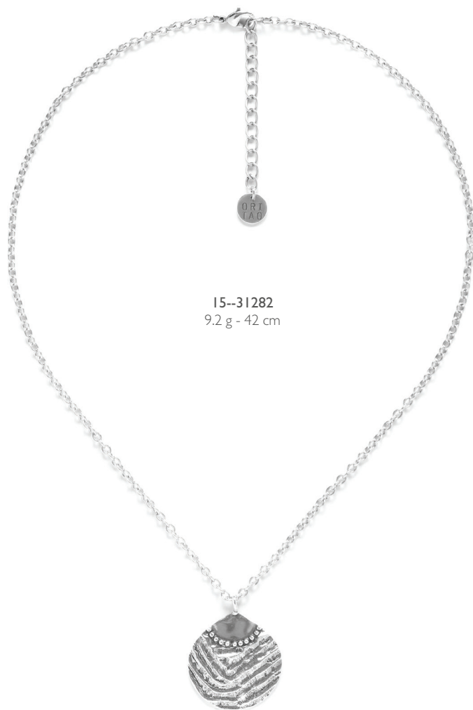
15--31282 9.2 g - 42 cm