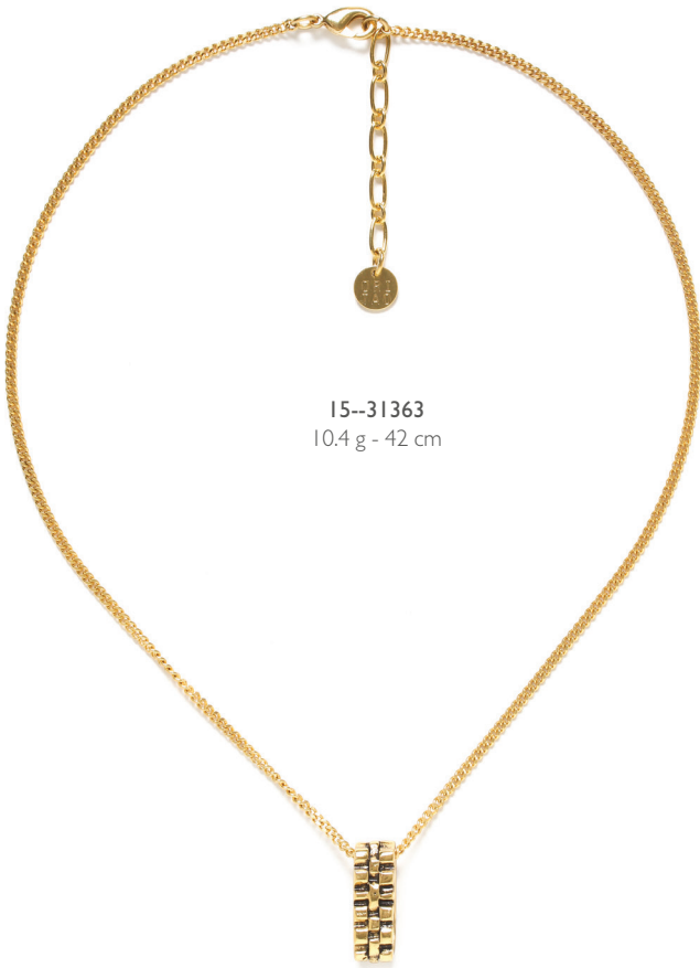
15--31363 10.4 g - 42 cm