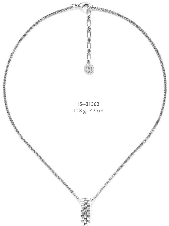
15--31362 10.8 g - 42 cm