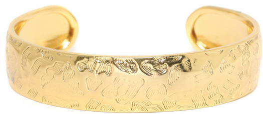
13--59881 21.5 g - 58 cm