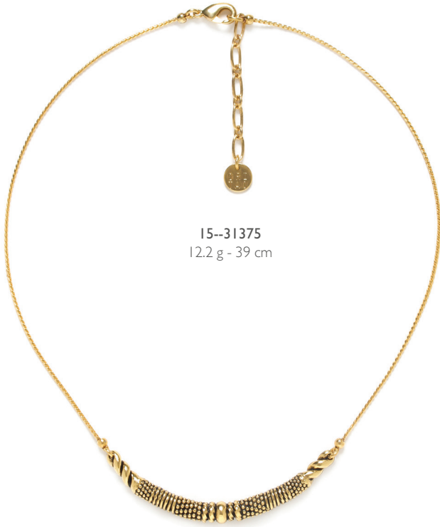
15--31375 12.2 g - 39 cm