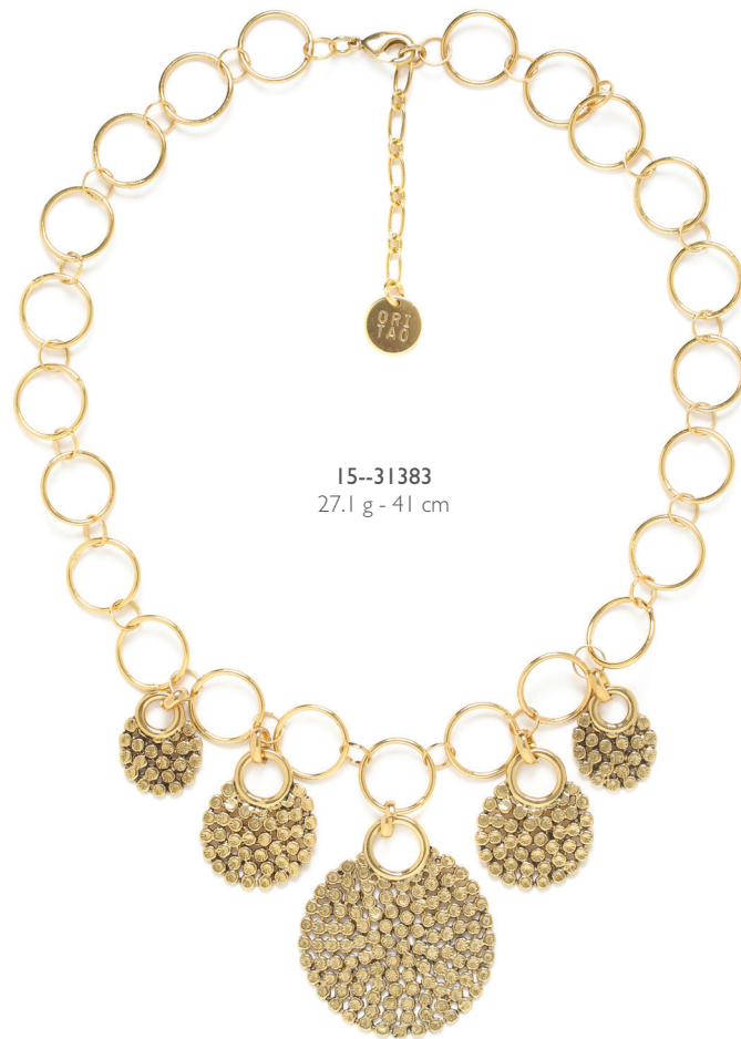
15--31383 27.1 g - 41 cm