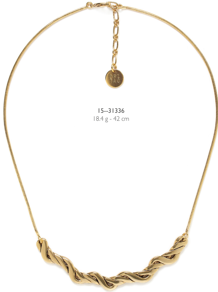
15--31336 18.4 g - 42 cm