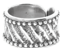
19--40070 7.7 g - 54 cm