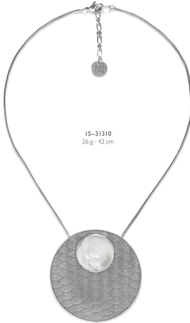
15--31310 26 g - 42 cm