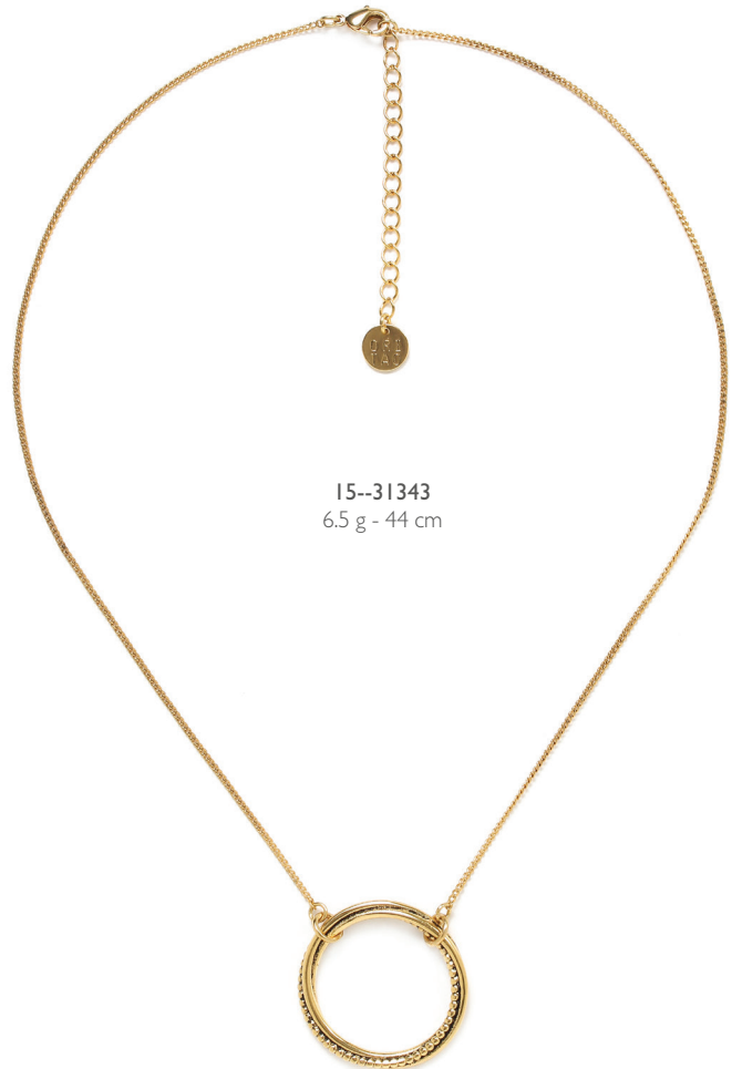
15--31343 6.5 g - 44 cm