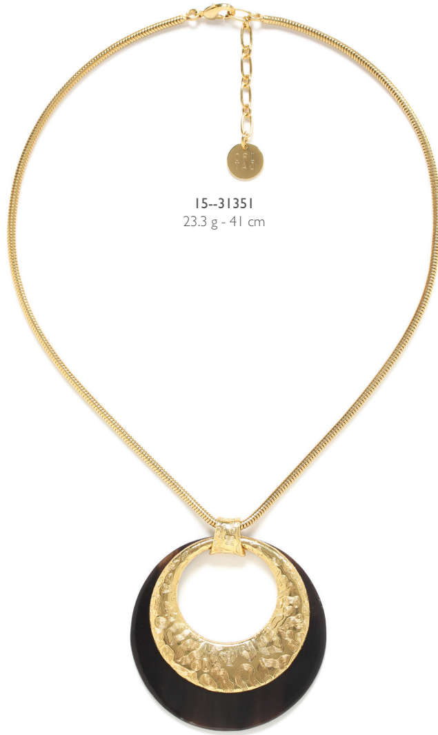
15--31351 23.3 g - 41 cm