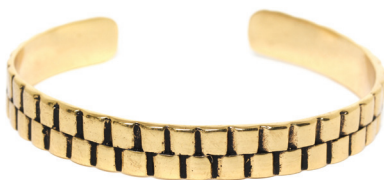
13--59893 17.5 g - 58 cm