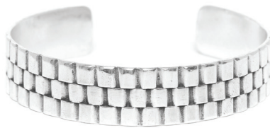
13--59890 27.2 g - 58 cm