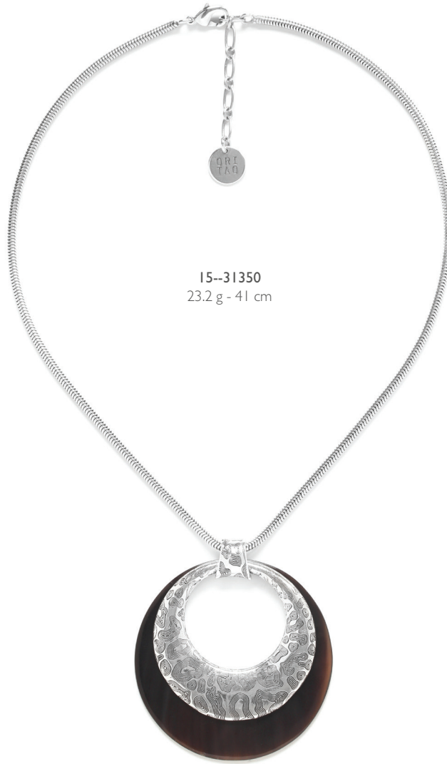
15--31350 23.2 g - 41 cm