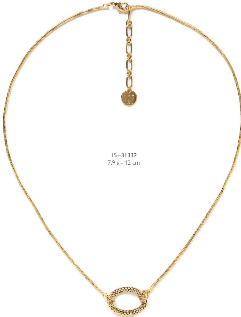
15--31332 7.9 g - 42 cm