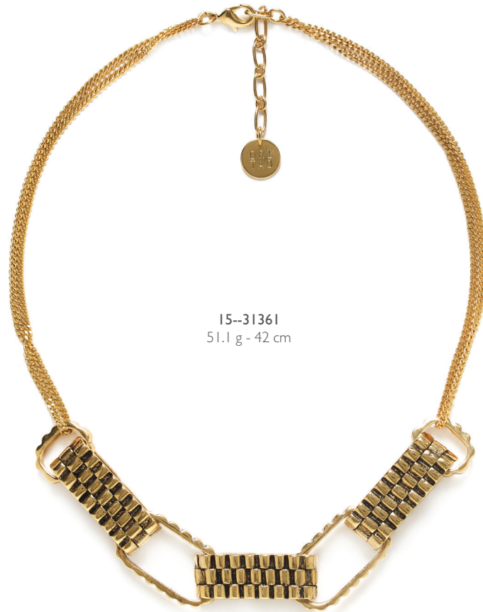
15--31361 51.1 g - 42 cm