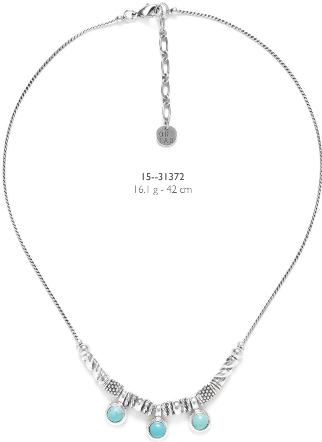
15--31372 16.1 g - 42 cm