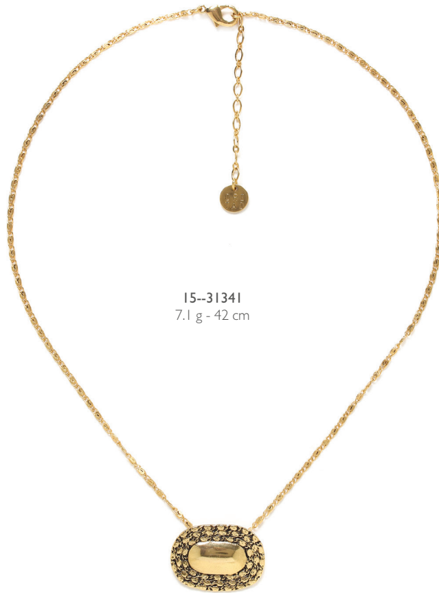
15--31341 7.1 g - 42 cm