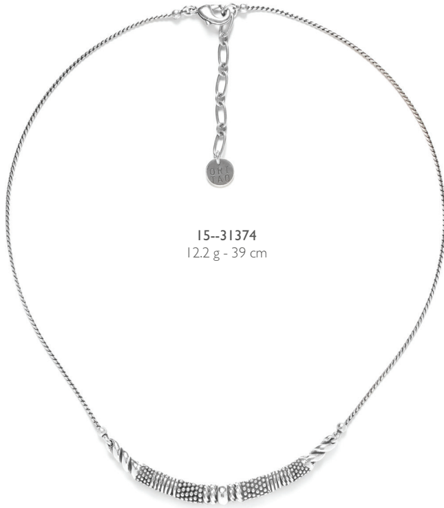
15--31374 12.2 g - 39 cm