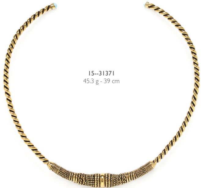
15--31371 45.3 g - 39 cm