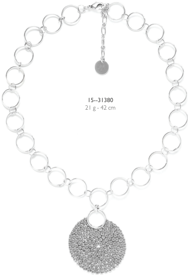
15--31380 21 g - 42 cm