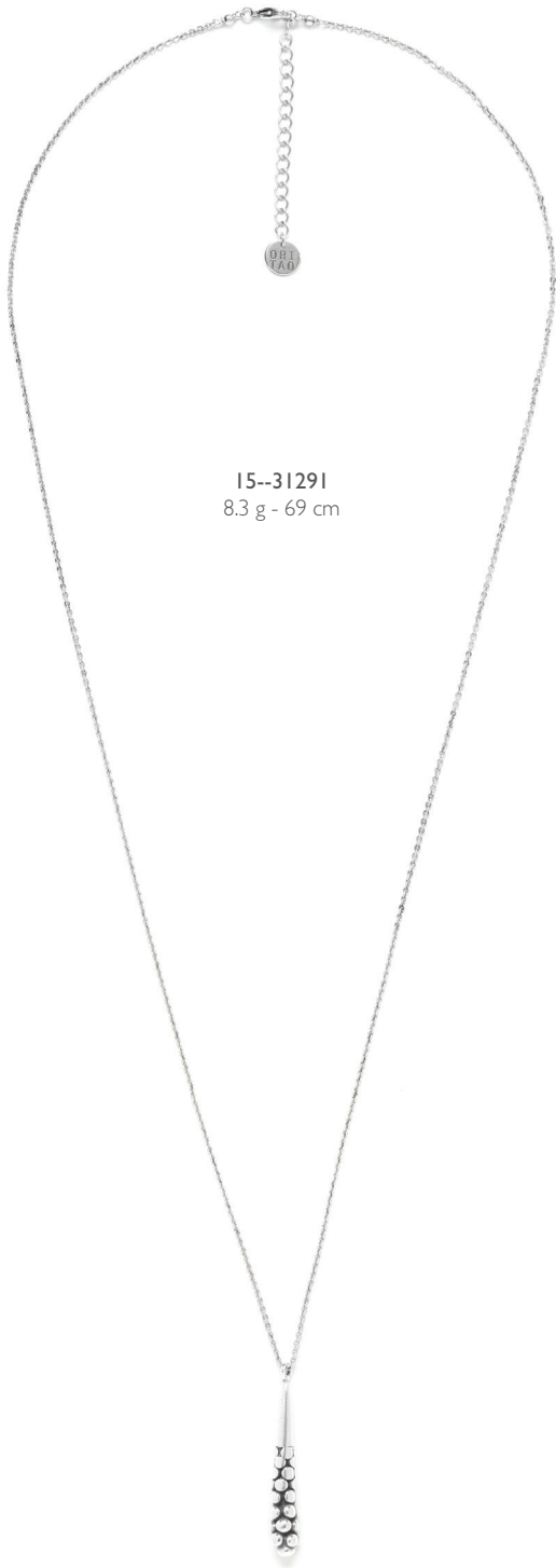
15--31291 8.3 g - 69 cm