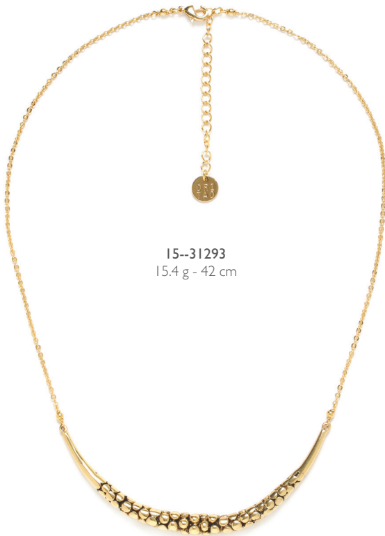
15--31293 15.4 g - 42 cm