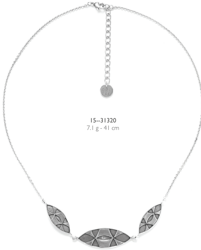
15--31320 7.1 g - 41 cm