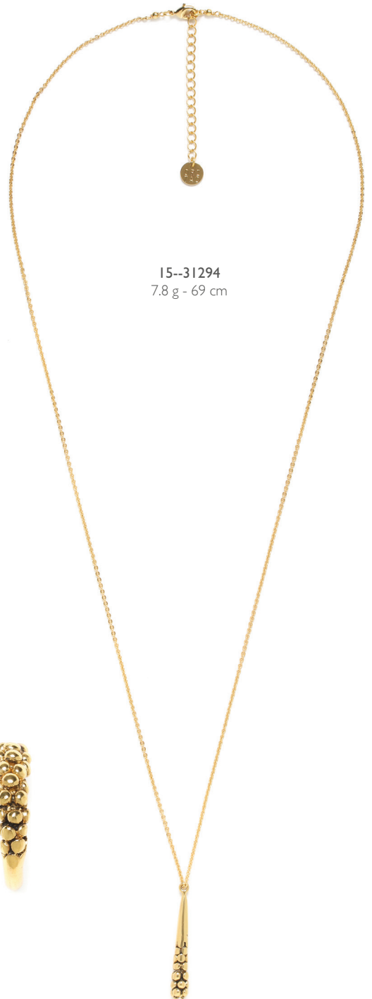
15--31294 7.8 g - 69 cm