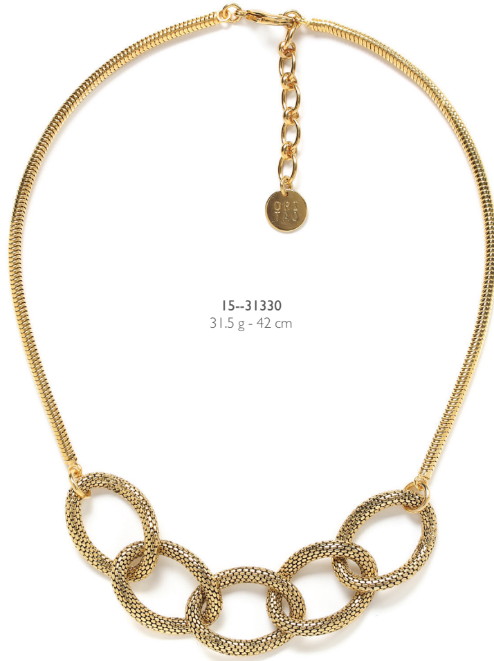
15--31330 31.5 g - 42 cm